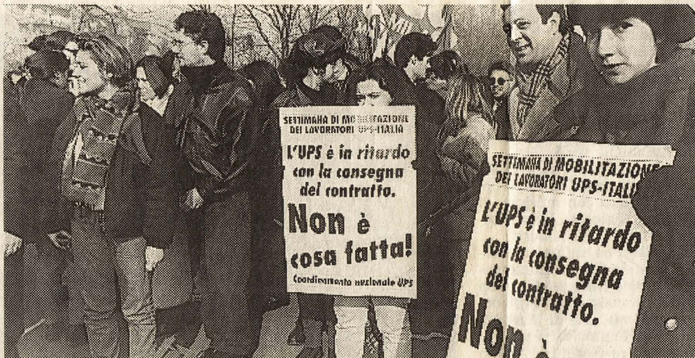
I dipendenti della Ups di Vimodrone durante la loro protesta.

Noi chiediamo un aumento salariale di 2 milioni su base annua - ha concluso il sindacalista - il controllo dei processi produttivi per quanto riguarda nastri lavorativi, trasferimenti, diritti sindacali, flessibilità, straordinari. Infine la costituzione di un coordinamento europeo per controllare i processi produttivi ed i lavori affidati a terzi».