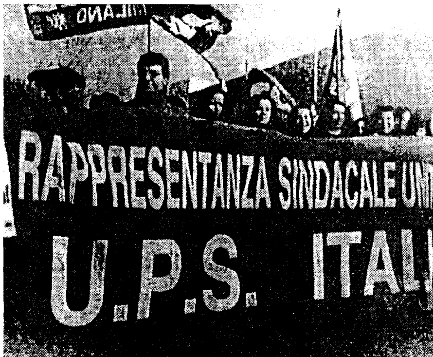
Una manifestazione dei dipendenti italiani del corriere espresso Ups contro l'annuncio di 150 licenziamenti