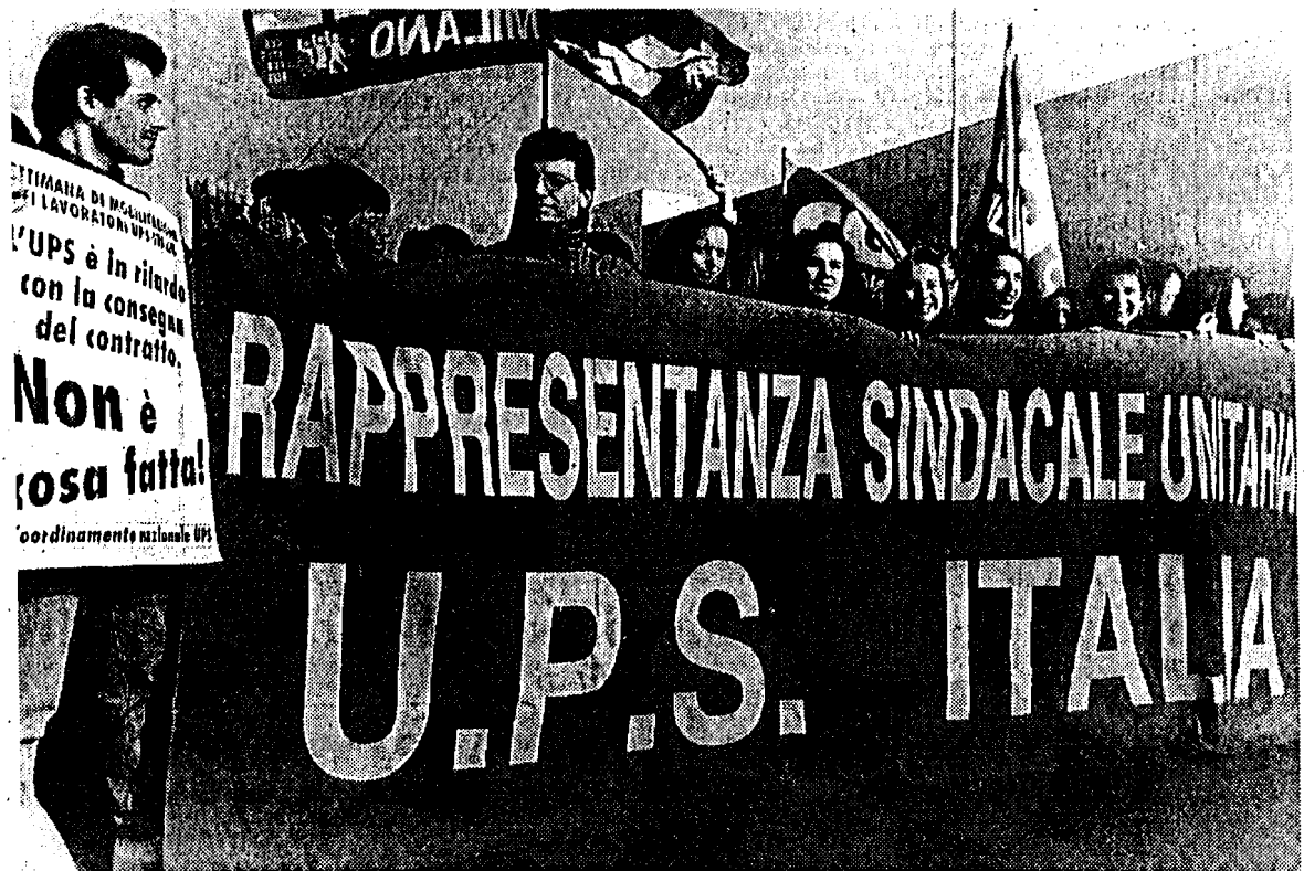
Il corteo dei lavoratori della Ups durante la manifestazione sindacale per chiedere la revoca dei licenziamenti.

I lavoratori ritengono che non vi è nessuna crisi in atto e che se passerà questa ristrutturazione, ne seguiranno altre, mettendo a repentaglio altri posti di lavoro. Nella loro piattaforma di rivendicazione i dipendenti Ups chiedono: la revoca dei 150 licenziamenti; trasparenza sui libri contabili della società a livello nazionale ed estero per dar modo ai delegati di verificare la gestione; riduzione dell'orario di lavoro, a parità di salario, dopo i miglioramenti tecnologici del processo di automazione; una giornata di azione sindacale internazionale entro aprile prossimo.